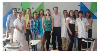
Socialización de las Fichas de Programa 9 de Diciembre de 2013