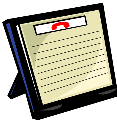
Pie de imagen o gráfico.

Conforme a lo anterior la presente línea contiene aspectos como: Talento Humano, Comunicaciones, Control Interno, Jurídica, Aseguramiento de la Calidad, Bienes y Servicios, Planeación, SIAU, Sistemas de Información, Mercadeo e Investigación.