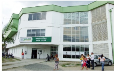
Unidad Intermedia del Sur

Generar la investigación clínica, mediante un permanente esfuerzo técnico y humano en nuestro Centro de Estudios e Investigación en Salud (CEIS) en conjunto con los patrocinadores públicos o privados, para que se incremente el número y la calidad de los estudios clínicos en la Región”